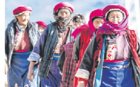
藏族妇女日常喜欢穿传统藏装。