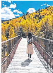
在秋林里漫步，茂密的树枝遮挡不住阳光。