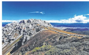
海拔4500米的石卡雪山的自然景观是动态的。

酥油茶是藏族特色茶饮，甜甜咸咸，奶味浓重。制作酥油茶时，先将茶叶用水久熬成浓汁，再把茶水倒入酥油茶桶，放入酥