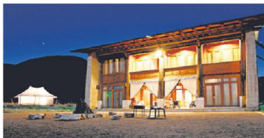
有150年历史的藏式住宅曾经是村长的家。

香格里拉的夜晚很宁静，满天繁星。秋季日夜温差大，沉浸在大自然中的我，夜在静谧的山谷中安然入睡。隔天一早，在鸟儿的明啾鸣啭中睁开惺忪的睡眼，阳光透过帐篷洒入帐房，清晨被大自然的阳光唤醒，绝对是难能可贵的体验。