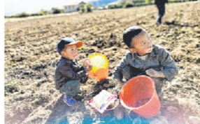
丰收的日子，小朋友化做小农夫，帮忙捡马铃薯。